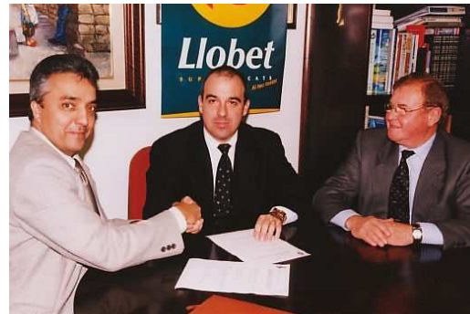
AMB SUPERMERCATS LLOBET