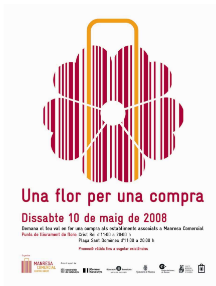
REPARTIMENT DE FLORS AMB MOTIU DEL DIA DE LA MARE