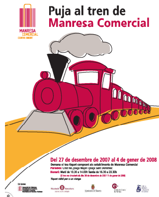
EL TREN DE NADAL