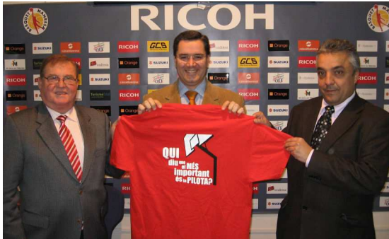
AMB EL RICOH MANRESA