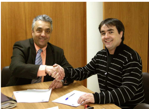
AMB EL CENTRE ESPORTIU VIASPORT