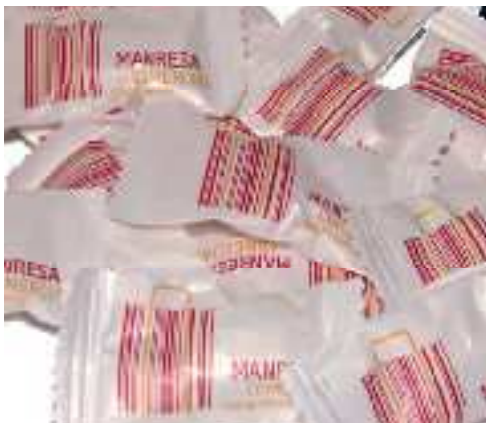
REPARTIMENT DE CAMELS