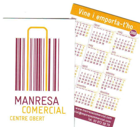
DISTRIBUCIÓ DE CALENDARIS